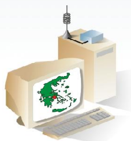
GIS infomatic server